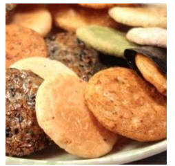
埼玉草加市と言えば「草加煎餅」

先日、依頼を頂き福島県白河と埼玉県草加市へお邪魔しました。福島へは何カ月ぶりの再会でお邪魔で久しぶりの再会で心厚くなりました。依頼者の方の希望は声なき声を聞きたい、そして堂々めぐりしている自分をどう受け入れるか。みんな多かれ少なかれ悩みを抱えています。踏み出す勇気を持てば未来は開けます。皆同じです(*>*)そして、初めての埼玉！不思議体験いっぱいでした。依頼者の方ご家族とそしてその方のご縁の方に合わせて頂き感謝の2泊3日でした。埼玉の方お会いさせて頂くと、まず第一声が「私、おばけについています?」それにはびっくり! ついてませんよ! ある意味、何かのせいにする方が気分が楽なのでしょうか?今の現状は全て自分が選択した結果ですよ